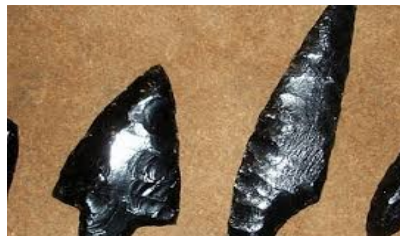
Punte di lance in ossidiana