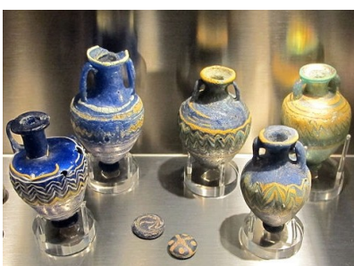
Vasetti di pasta di vetro fenici 450 a.C

Oltre 5000 anni fa, la lavorazione del vetro cominciò in Mesopotamia, poi in Egitto e nell'attuale zona di Israele e della Palestina, dove si trovano grandi quantità di sabbia silicea. Pian piano, la tecnica si diffuse anche in altri paesi, ma il massimo splendore della lavorazione del vetro fu raggiunta a Venezia, dove i mastri vetrai furono addirittura obbligati dalle autorità a conservare gelosamente il segreto della loro arte.