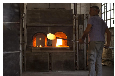
Maestro vetraio al lavoro