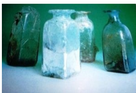
Antiche bottiglie romane II sec. d.C.