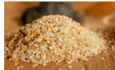
Sabbia di quarzo

Oltre 5000 anni fa, la lavorazione del vetro cominciò in Mesopotamia, poi in Egitto e nell'attuale zona di Israele e della Palestina, dove si trovano grandi quantità di sabbia silicea. Pian piano, la tecnica si diffuse anche in altri paesi, ma il massimo splendore della lavorazione del vetro fu raggiunta a Venezia, dove i mastri vetrai furono addirittura obbligati dalle autorità a conservare gelosamente il segreto della loro arte.